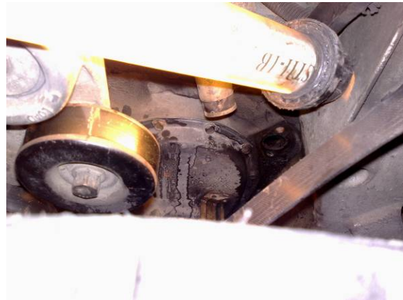
Rens og fjern evt pakningsrester rens gjenger