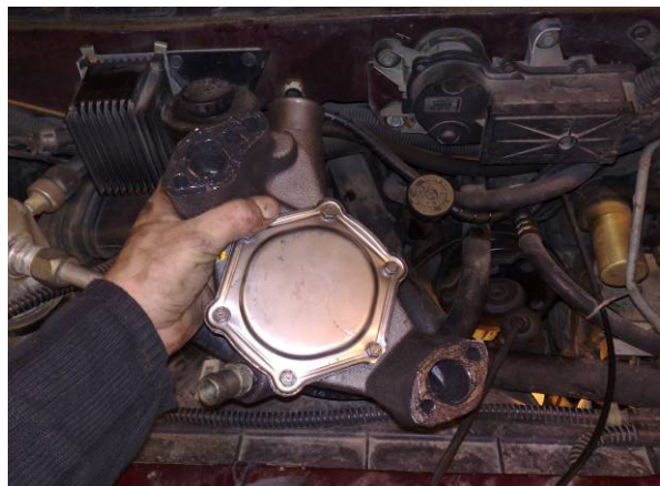
En god pakningsement husk også silicone på boltene som er i kontakt med vann, jeg lot siliconet mot pumpen og pakningen herde i 10 min slik at de var fast