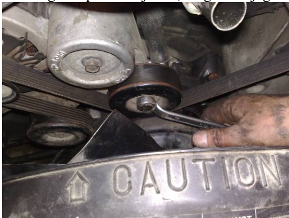
Så var det bare og tre på remmen og sette denne på plass, fyll på veske og la den gå ut luften med radiatorkappen av følg med tempmåler