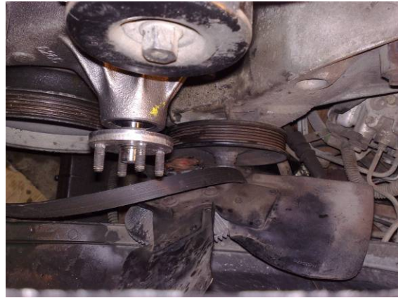
Litt krangel med boltene og en pakning som løsnet, lirk så viften på plass