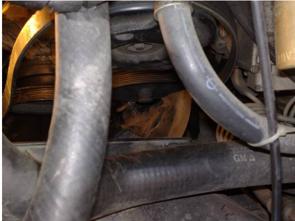
Viften skjøvet under servopumpen